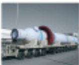
● Heat exchangers