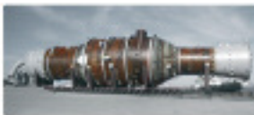
● Large columns