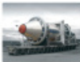
● Waste heat boilers